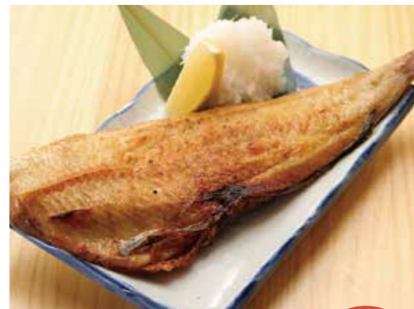
⑦ホッケ一夜干し (ハーフ)