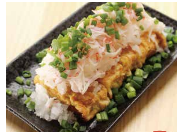
⑨海鮮 だし巻たまご