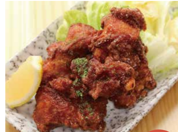
③とりザンギ (とりから)