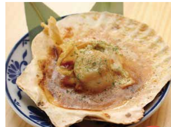
⑧大判ホタテ バター焼き 1枚