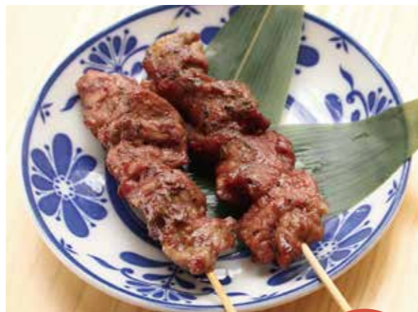
⑥ジンギスカン串 1本