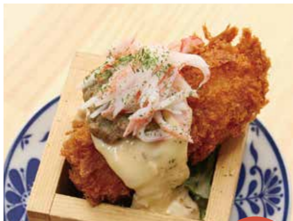
⑤カニクリーム コロッケ